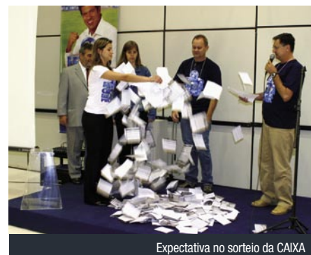
Expectativa no sorteio da CAIXA