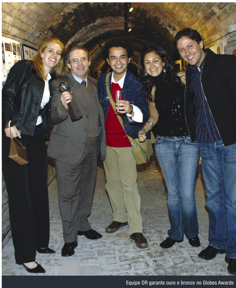
Equipe DR garante ouro e bronze no Globes Awards