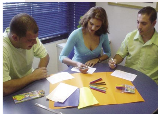
Promotores ganham dicas sobre o processo seletivo, entrevistas e dinâmicas de grupo